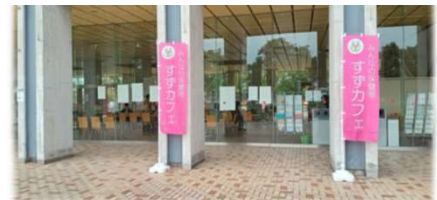
ピンクののほり旗が目印です