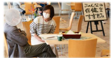
お茶を飲みながらゆっくり相談