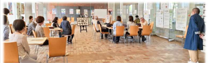
20分程度のミニ健康講座も開催しています