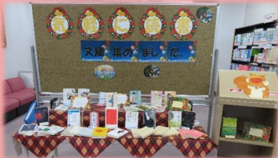
『*気軽に読書*文庫集めました』