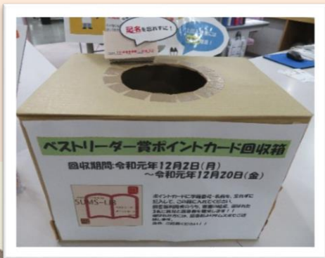
カウンター上のポイントカード回収箱