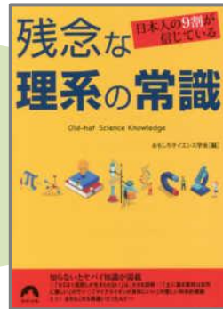
日本人の9割が信じている残念な理系の常識/おもしろサイエンス学会