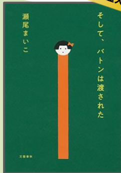
そして、バトンは渡された/瀬尾まいこ