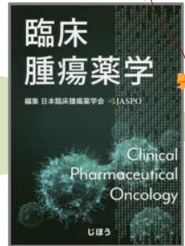
臨床腫瘍薬学/日本臨床腫瘍薬学会