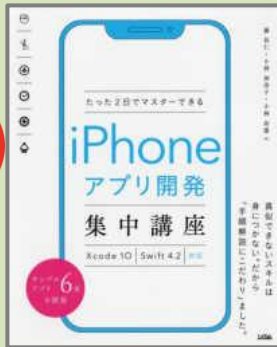
たった2日でマスターできる iPhone アプリ開発 集中講座/藤 治仁, 小林 加奈子, 小林 由憲