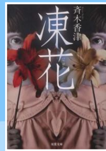
凍花 / 齊木香津著

検査・測定の目的と相対的位置づけをコンパクトに示しており、視覚的に把握しやすい。また、セラピストの実際の言動を交えながら記述することによって、臨場感の高い情報収集の想定を可能としている。