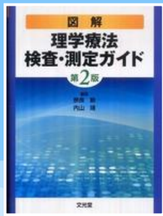
図解理学療法検査・測定ガイド / 奈良勲, 内山靖編