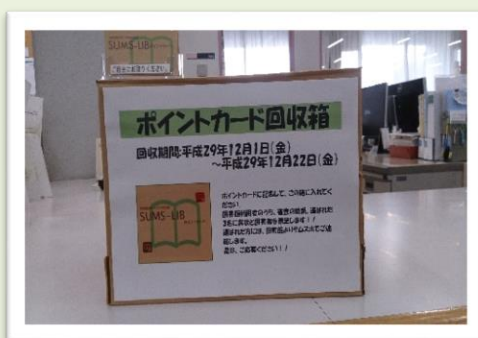
カウンター上のカード回収箱