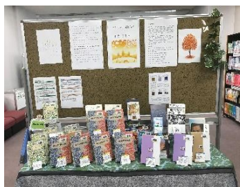
千代崎 児童文学名作