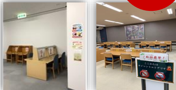
千代崎：トリックス2F 白子：後ろから2列