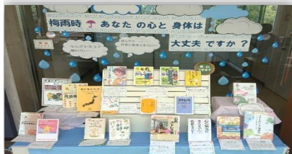
「梅雨時 あなたの心と身体は大丈夫ですか？」