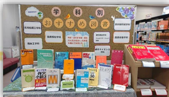
「学科別 おすすめ図書」