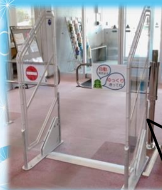
自動扉が開くのを待ってから お帰りください。